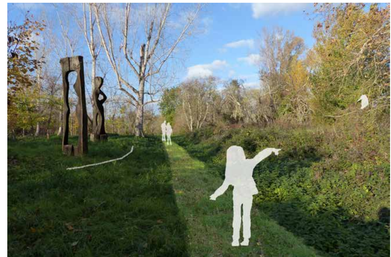
6_Land art et interventions modestes (gestion différenciée, repères dans le parcours) : Ile de St-Cassian