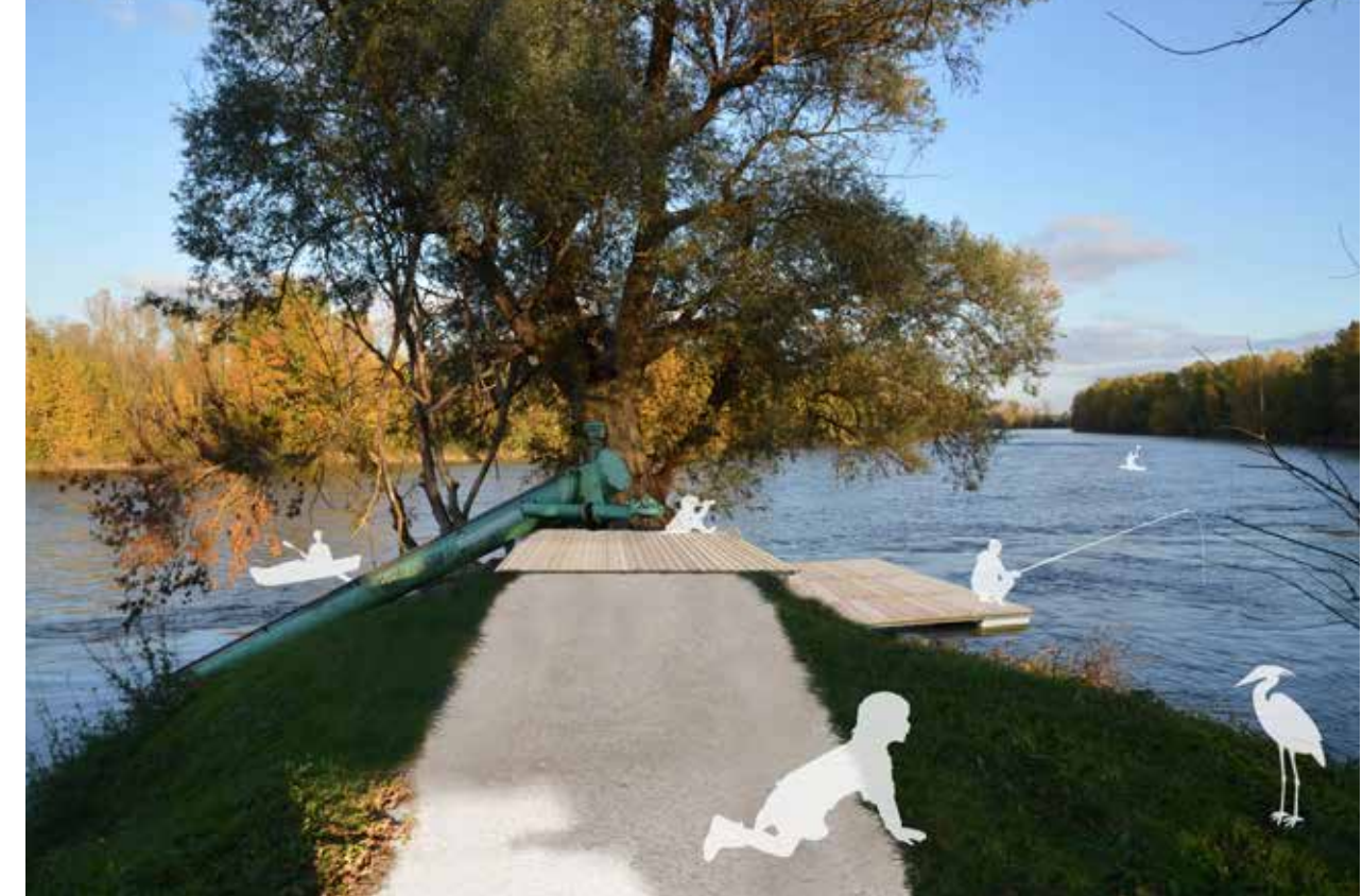
8_Dernier accès aux digues et aménagements fluviaux : la Pointe de l'Agasse