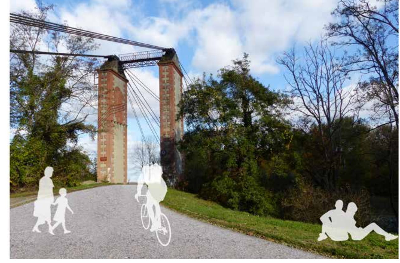
5_Ouverture aux modes actifs des grands éléments du territoire : pont de Gisclard à Bourret