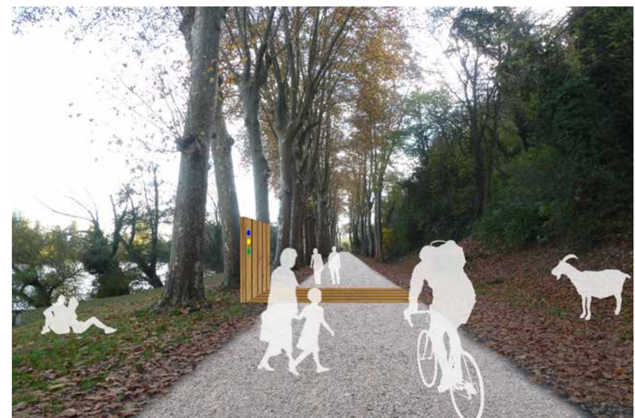
4_Ouverture aux modes actifs des grands éléments du territoire : allées du pont de Gisclard à Bourret