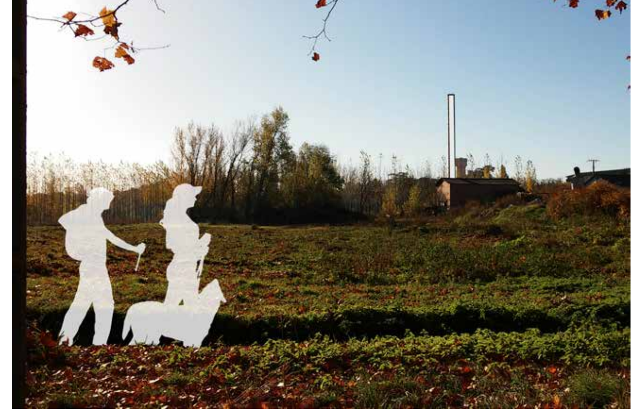
3_Des repères hauts dans la plaine : plaine à Verdun-sur-Garonne