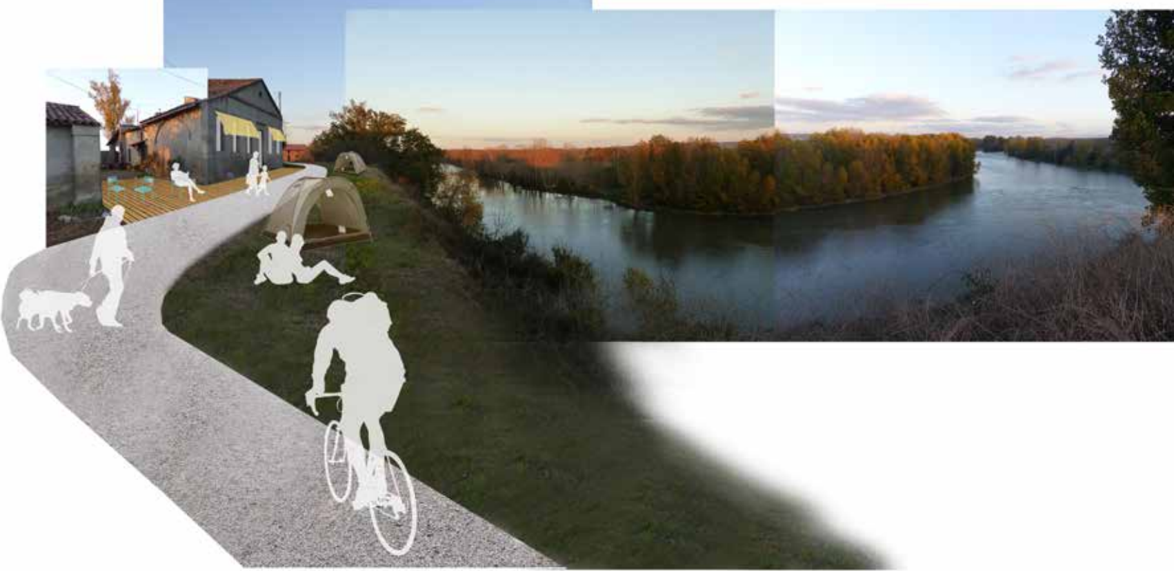
1_Des points de vue à réinvestir : bivauc de La Roche St Martin, Verdun-sur-Garonne