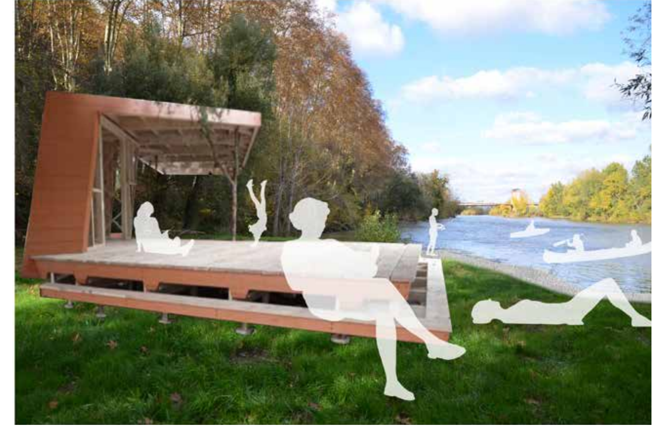
7_Aménagements et loisirs saisonniers au contact de la Garonne : plage de Bourret