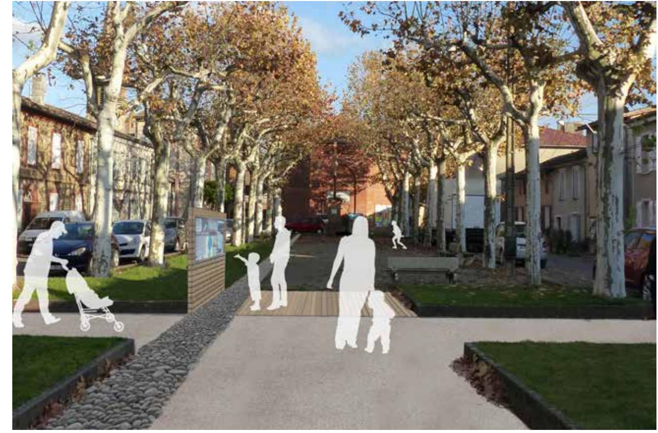
2_Des points de départ en centre ville : place du Clôt de Mas-Grenier